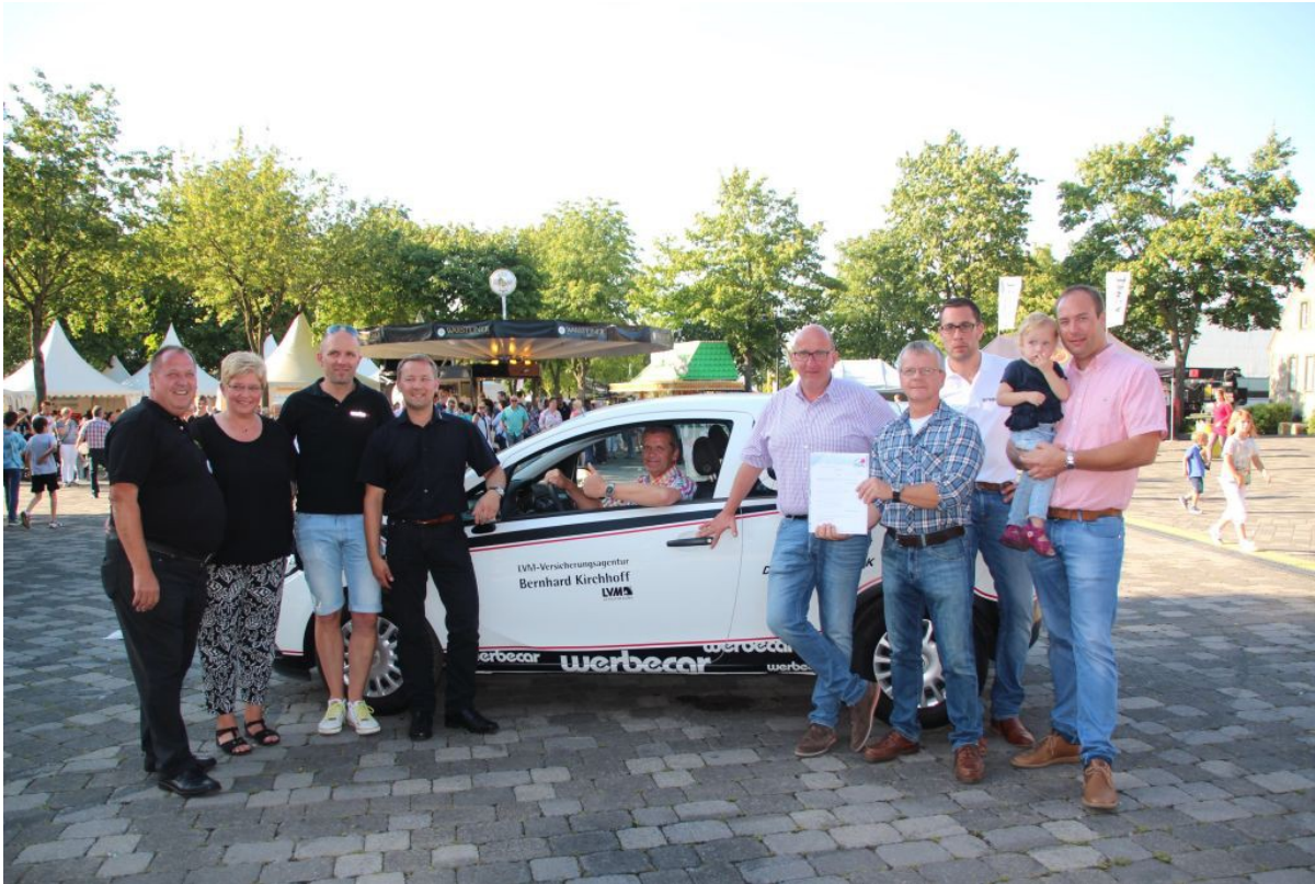
Steinfestauto 2016